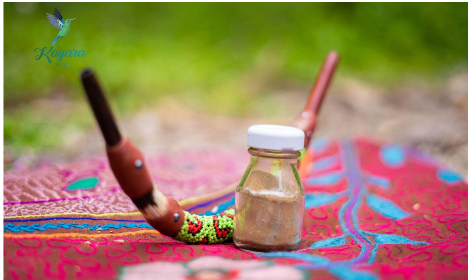
Rapé . Kayara Store .

"La medicina no es únicamente el rapé, sino la intención de la persona que hace la proyección del rapé. Es un canal de la energía del espíritu, entonces debe de estar neutra para dar esa medicina y tener una intención sanadora para la otra persona"